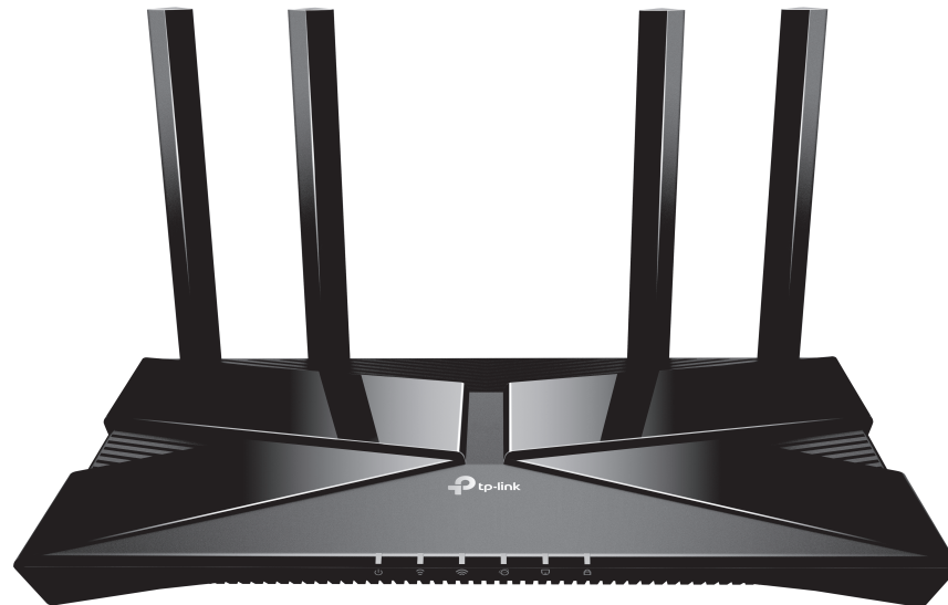
AX1500 Wi-Fi 6 ルーター